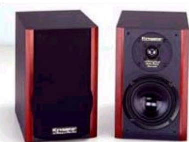
SILVERLINE 60 Mini Monitor Høyde 29,5 x B 19 x D 25

Optimalt tilpasset høyttalerstativ, med innlagt mahogny i foten som dekker kablene og to sett spikes. Leveres som option