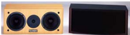
PRISMA Center speaker 105 Høyde 20 x B 46 x D 18 cm

Fordi PRISMA har en slik høy virkningsgrad, eller lettdreven, trekker PRISMA mindre effekt fra forsterkeren enn det som er vanlig. Du kan benytte PRISMA for forsterkere med rør eller transistorer og få bedre lyd. Velg en mindre forsterker og bruk prisdifferansen å oppgradere til en større modell av PRISMA i PRISMA-serien og du får et bedre anlegg for samme pris! Den høye virkningsgraden gjør at PRISMA kan tilkobles små rørforsterkere ned til 2 x 10 watt.