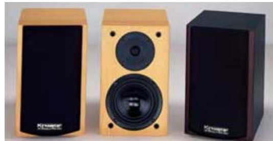
PRISMA 55 Mini Høyttaler vist i bøk og svart. Høyde 29 x B 18 x D 23 cm