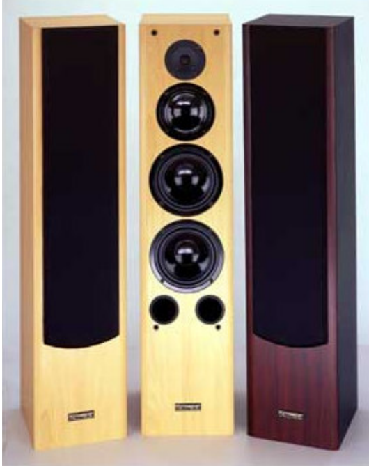
PRISMA 210 Tower , vist i bøkefarge Høyde H 105 x B 23,5 x D 26,5 cm

Prisma er en høyttalersserie som har fått mange sterke lovord, fra å være det "Best Buy" til å bli testet som alene på toppen av de aller beste. For å få en hyggelig pris har vi lagt høyeste prioritet på deler og egenskaper som har en sterk innflytelse på lyd kvaliteten, mens vi har utelatt ting som øker prisen, uten å senke lyd kvaliteten som PRISMA er blitt berømt for gjennom årene.