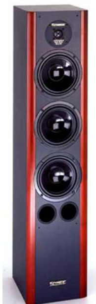
SILVERLINE 220 Svart med massiv Mahogny Høyde 110 x B 23,5 x D 26,5 cm

Lydentusiaster investerer mye penger i gode kabler mellom høyttaler og forsterker. Derfor er det viktig at høyttalerens innvendige kabler også er av høy kvalitet. SILVERLINE har sølvbelagte kabler, som er spunnet av opptil 511 tråder! Det gir minimal motstand og høy ledeevne, slik at selv de svakeste lydimpulser slipper igjennom. I tillegg sørger doble gullbelagte kabeltilkoblings-terminaler, såkalt Biwiring, for optimal kontakt og signaloverføring.