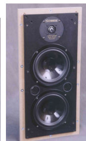
Inwall 120 B 26 x D 7,5 x H 55cm