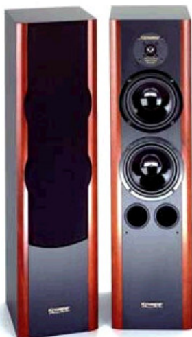
SILVERLINE 120 Svart med massiv Mahogny Høyde 90 x B 23,5 x D 26,5 cm