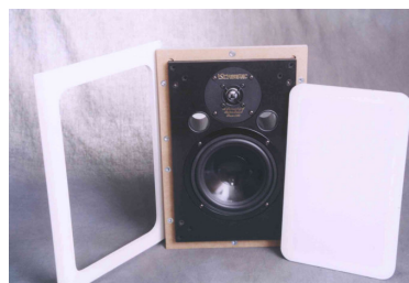
Silverline Inwall 90 B 25,5 x D 7 x H 39,5 cm