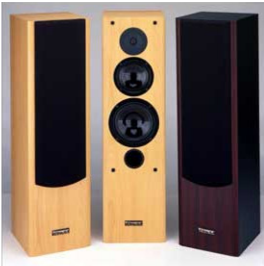
PRISMA 110 Tower , vist i bøkefarge Høyde 85 x B 23,5 x D 26,5

Den viktigste videreutviklingen av den nye PRISMA er den meget spesielle mellomtonehøyttaleren som vist ovenfor. Her er membran og opphengskant laget i ett stykke. Slik unngås forvrengning forårsaket av sammenlimingen av membran og kant. Resultatet er en eksepsjonelt klar mellomtone. Vel så viktig er at den er montert i en egen boks, som er et lukket kammer, slik at membranet ikke påvirkes av innvendige lufttrykkvariasjoner skapt av bassen. Derved oppnås optimal frekvensgang og enda mer klarhet i lyden. Alle blir fullstendig like.