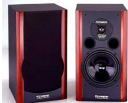
SILVERLINE 90 Monitor Høyde 42 x B 23,5 x D 26,5 cm

Optimalt tilpasset høyttalerstativ, med innlagt mahogny i foten som dekker kablene og to sett spikes. Leveres som option