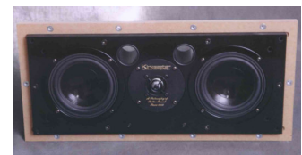
Silverline Inwall Center SLC 150 B49,3 x D7x H22cm

Alt du ser av høyttalerne og kabeller når disse er montert i veggen er en hvit ramme, som kan males i ønsket farge tilpasset interiøret for øvrig. Lyden er like god som for kabinetmodeller.