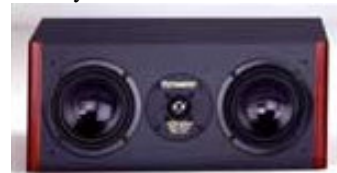
SILVERLINE Center 150 SLC Høyde 20 x B 46 x D 18

Denne Centerhøyttaleren er for bruk i et hjemmeteater, over eller under TV'en, for å fylle "lydhullet" mellom de to høyttalerne i fronten. Alle elementene er magnetisk avskjermet for å beskytte TV'en.